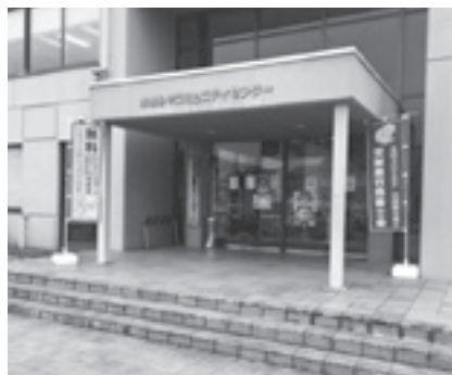
会場入口の“のぼり”