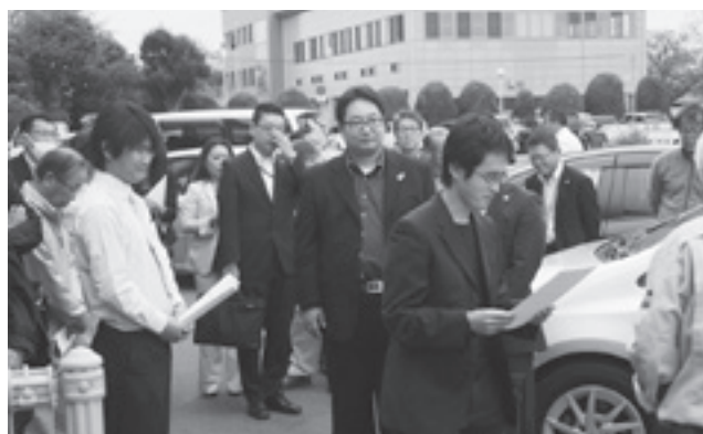
茨城運輸支局での封印見学