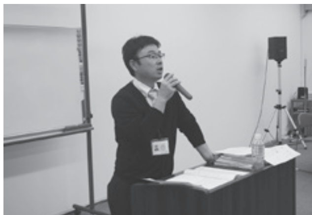
講師の久保国土農地部長