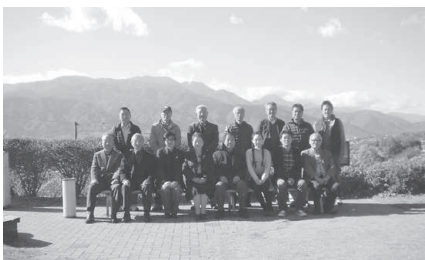
四釜支部長を中心に絶景!!