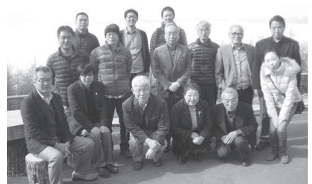
皆さん、良い笑顔です!!