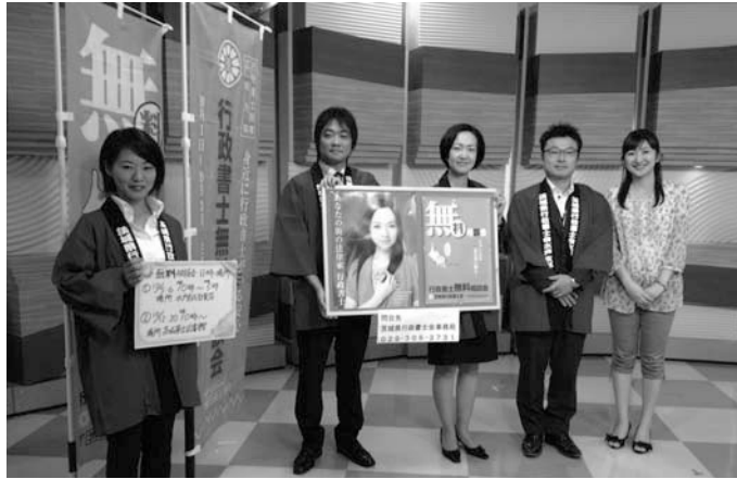
NHK水戸さんの放送で、相談会をしっかりアピール！！