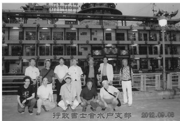
上海ナイトクルーズ