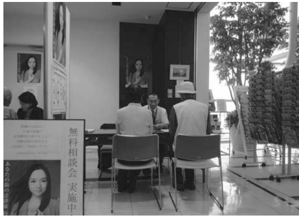
京成百貨店さんでの相談会の様子