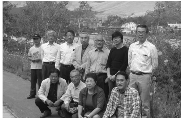
白樺湖での集合写真