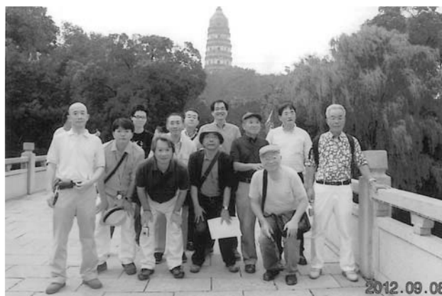
東洋のピサの斜塔（虎丘）