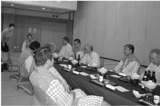
ホテルでの懇親会