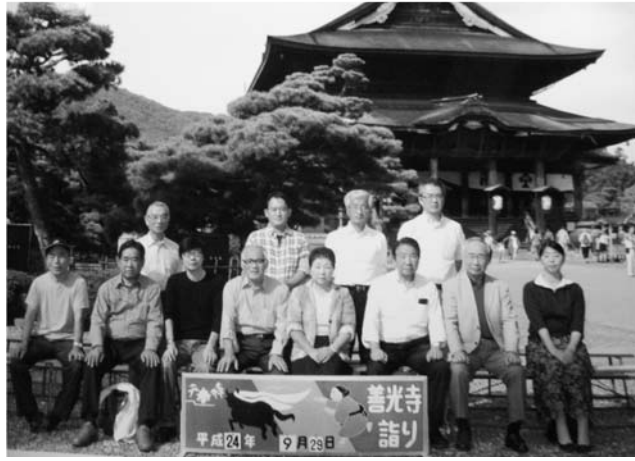
善光寺にての集合写真