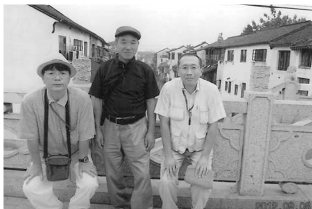
運河下りを終えて