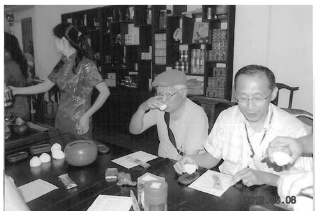
中国茶のセールス中